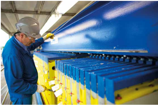
Eigenes, qualifiziertes Fachpersonal bedient unsere mobilen Anlagen vor Ort