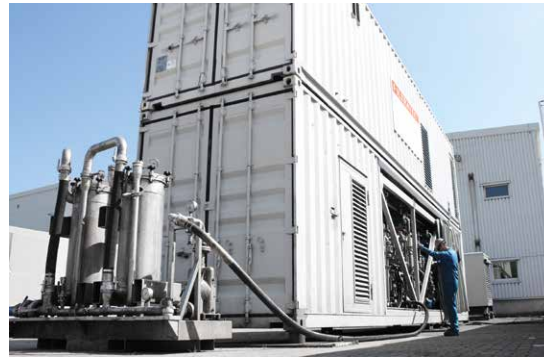
Durch die Stickstoffüberlagerung kann innerhalb der gasdichten Dekanter von FILTRATEC keine Ex-Zone entstehen. In nur einem Arbeitsgang werden drei Phasen (Öl, Wasser und Feststoff) produziert