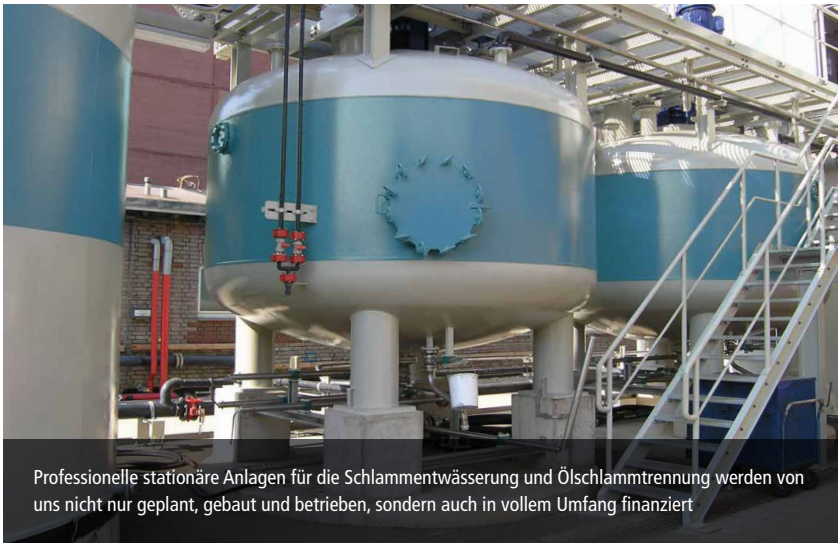
Professionelle stationäre Anlagen für die Schlammentwässerung und Ölschlammtrennung werden von uns nicht nur geplant, gebaut und betrieben, sondern auch in vollem Umfang finanziert

FILTRATEC ist spezialisiert auf die Schlammentwässerung und Ölschlammtrennung in der Industrie. Für diese anspruchsvolle Aufgabe sind wir in jeder Hinsicht gut gerüstet. Kunden aus der chemischen und petrochemischen Industrie, der Eisen- und Stahlerzeugung sowie dem Bau- und Entsorgungssektor nutzen unsere Dienstleistungen seit über 40 Jahren.